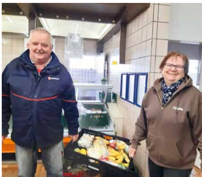
Ohne fleißige ehrenamtliche Helfer geht nichts!