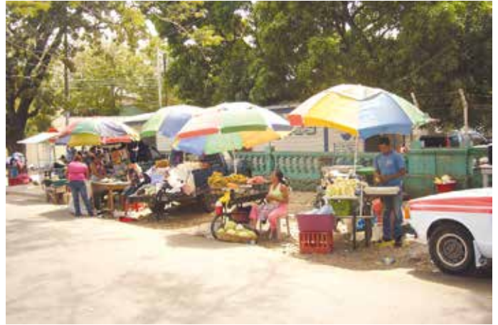
Straßenmarkt in Honduras

Besser ist sicherlich geworden, dass wir viele neue Techniken und Methoden haben, ich denke nur an die Knopflochchirurgie, an die computergesteuerte Chirurgie oder an die verbesserten Materialien. Was sich aber eindeutig verschlechtert hat, ist die Ökonomisierung im Gesundheitswesen, der Druck, dass Gewinn gemacht werden muss. Mit dem neuen Gesundheitsminister Lauterbach wird das nun in Frage gestellt. Endlich sagt einmal jemand, dass die Feuerwehr schließlich auch keinen Gewinn machen muss. Die kostet uns Geld, aber die brauchen wir, wenn es brennt. Ein Krankenhaus und eben das ganze Gesundheitswesen hat auch erhebliche Vorhaltekosten, die sind nun einmal da. Es ist nicht gut, wenn nur Wirtschaftler im Krankenhaus das Sagen haben. Die eigentlichen Fachleute werden nicht gefragt und als Arzt muss man dann schauen, wie man zurechtkommt. Auch die Verdichtung der Arbeitsbelastung durch Arbeitszeitverkürzung ist ein Problem. Als ich als junger Assistenzarzt angefangen habe, betrug die Wochenarbeitszeit 48 Stunden. Jetzt ist die Arbeitszeit 38.5 Stunden, es werden aber nicht entsprechend mehr Leute eingestellt. Die gleiche Arbeit muss in weniger Zeit geleistet