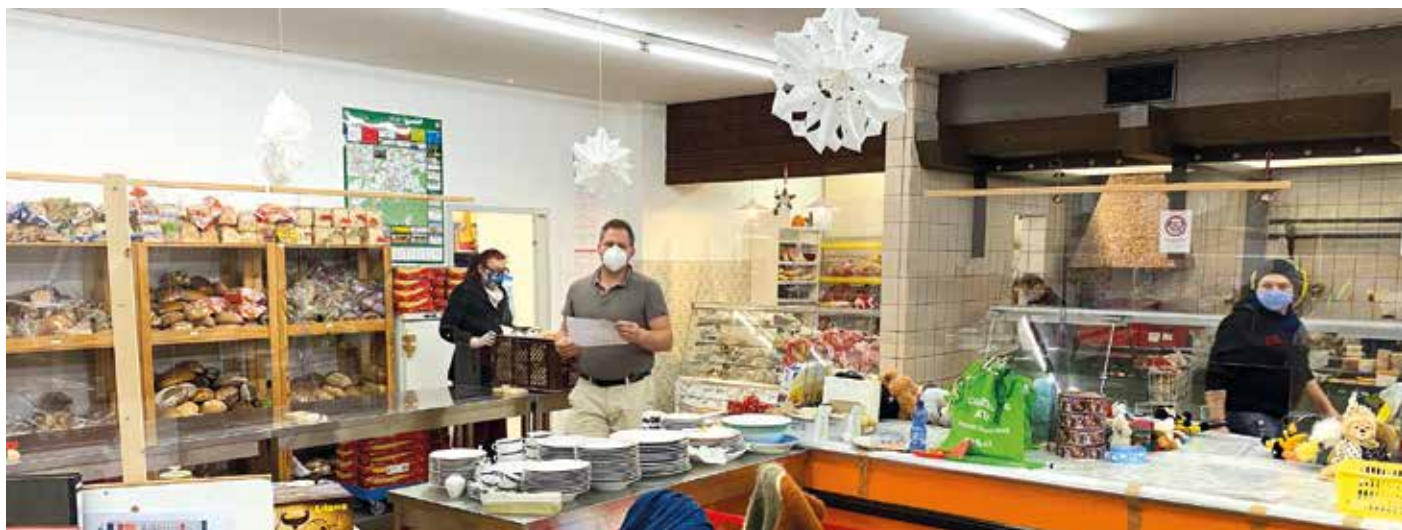
Stets gut gefüllt sind die Regale bei der Selber Tafel

An dieser Stelle darf nicht vergessen werden, dass die Tafel in diesen schwierigen Zeiten die steigende Zahl von Tafelberechtigten nur deshalb versorgen kann, weil viele mitfühlende Mitbürgerinnen und Mitbürger, aber auch Firmen, großzügig spenden.