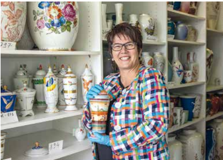
Petra Werner, Hauptkuratorin des Porzellanikon, © Porzellanikon, Foto: Andreas Gießler

Preis: 3,00 € / 2,00 € ermäßigt. Anmeldung unter hohenberg@porzellanikon.org oder Tel. +49 9233-77220.