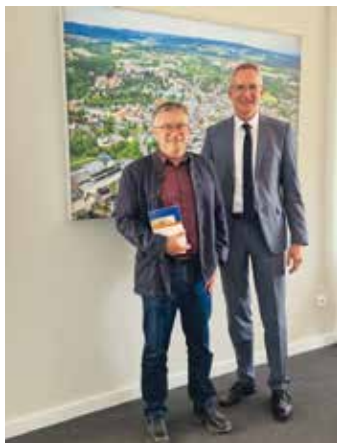
Günter Siegl und Oberbürger- meister Ulrich Pötzsch