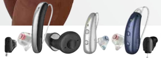
Signia IX Hörgeräte