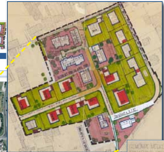
gescannter Bebauungsplan im pdf-Format