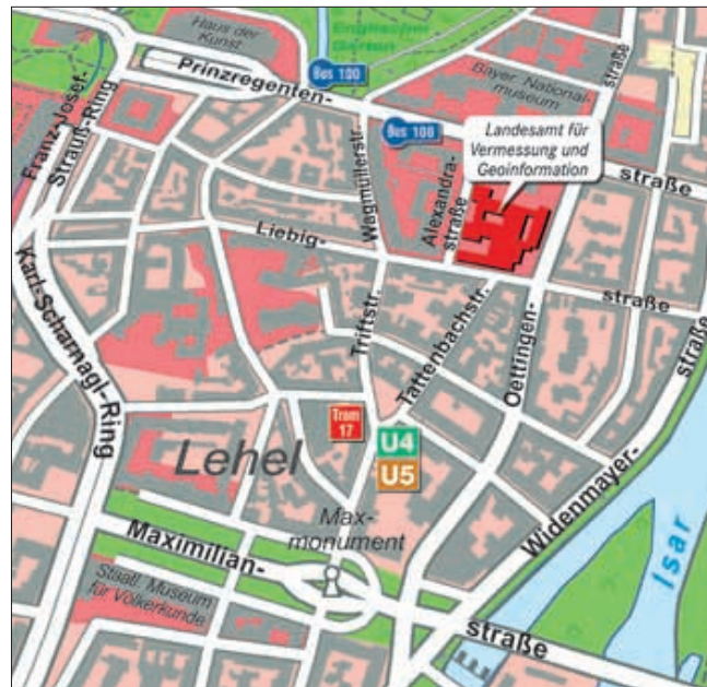
Grundlage: Digitale Ortskarte Bayern (DOK)

U-Bahn U4, U5 bis Lehel Straßenbahn Linie 17 bis Lehel Bus Linie 100 bis Nationalmuseum/Haus der Kunst