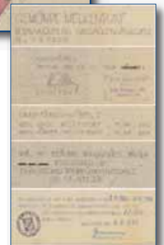
Textliche Festsetzung im pdf-Format