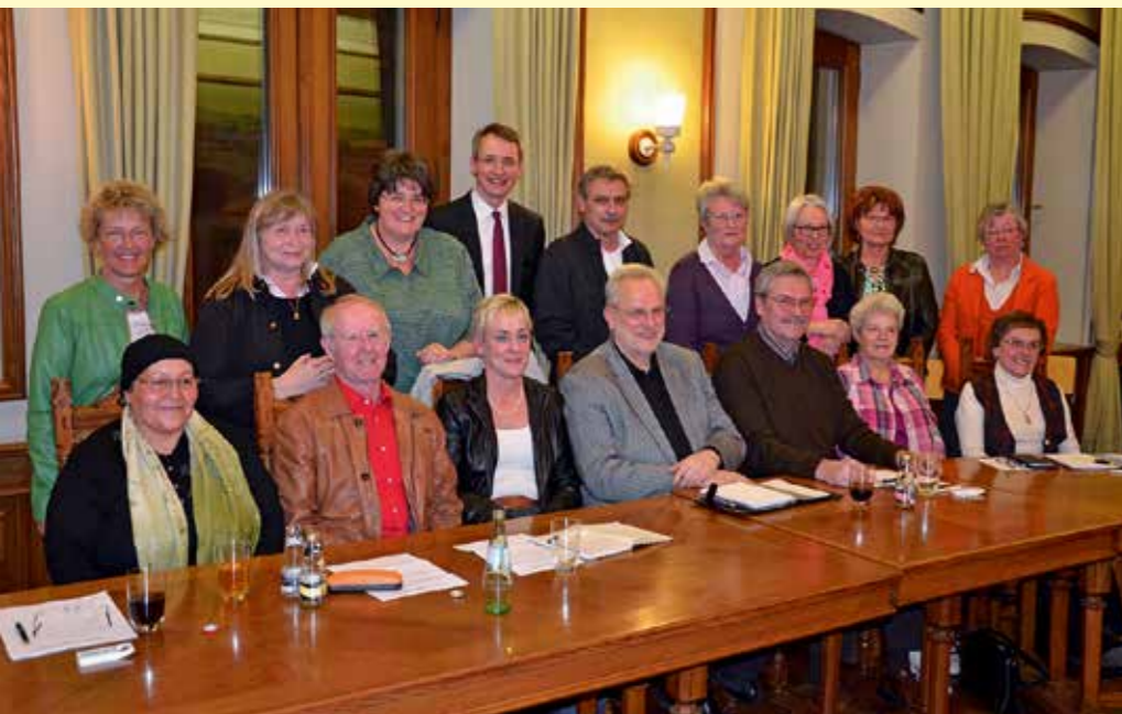
Der Seniorenbeirat der Stadt Selb mit Oberbürgermeister Uli Pötzsch